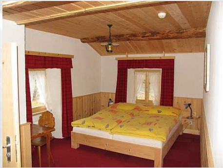
Zimmer 22 Doppelzimmer mit Dusche/WC

2 Einzel- und 3 Doppelzimmer mit fließend warm und kalt Wasser