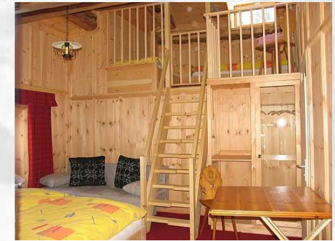
Zimmer 23 Doppelzimmer mit 2 Zusatzbetten und Dusche/WC 2 weitere Zusatzbetten möglich