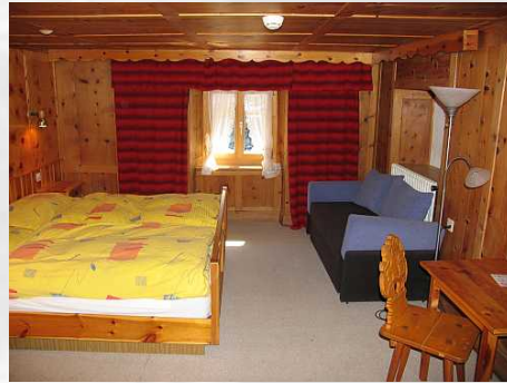
Zimmer 26 Doppelzimmer mit Zusatzbett und Dusche/WC