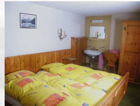
Zimmer 13 Doppelzimmer mit Etagendusche/WC