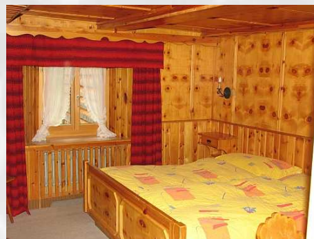
Zimmer 25 Doppelzimmer mit Dusche/WC