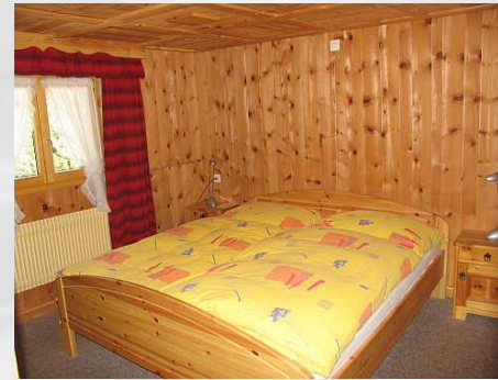
Zimmer 24 Doppelzimmer mit Dusche/WC