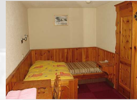
Zimmer 14 Einzelzimmer mit Etagendusche/WC