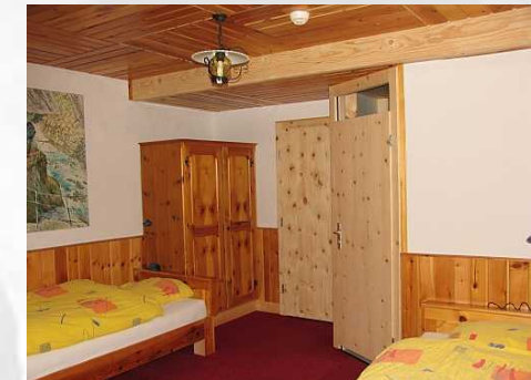
Zimmer 21 2 Bettzimmer mit Dusche und EtagenWC 1 Zusatzbett möglich