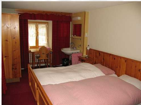
Zimmer 12 Doppelzimmer mit Etagendusche/WC