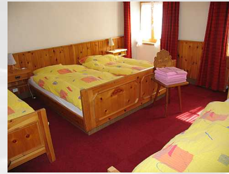
Zimmer 11 Doppelzimmer mit Etagendusche/WC und 2 Zusatzbetten